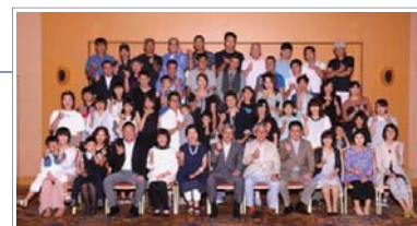
家族招待パーティー

車両年齢を考慮した燃費達成率とデジタコ評価点を、偏差値で評価しドライバーを表彰。H27年からチーム表彰も実施。半期表彰を兼ねて、社員家族を招待したパーティーを開催。